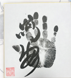
●力士直筆サイン例

お楽しみコーナー&抽選会も実施 開場直後からの力士四名による握手会のあと、力士に直接質問して大相撲の知識を深めていただける質問コーナーや、ご来場の皆様から抽選で20名様に、力士直筆サインや相撲土産が当たる、お楽しみ抽選会も行います。巡業ならではの楽しい企画が盛りだくさんです。